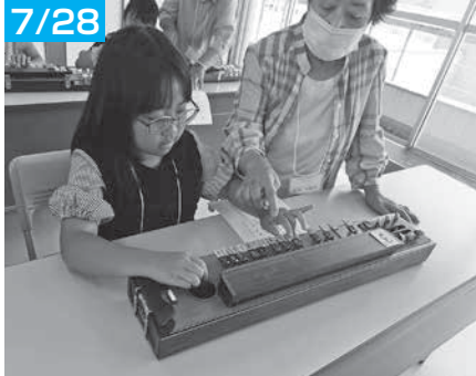
大正琴って弦をはじくのが楽しい！