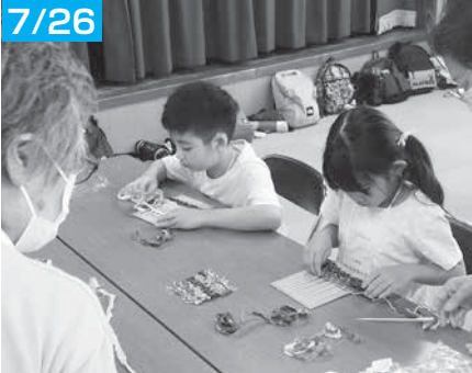
「さき織り」コースター上手にできたよ