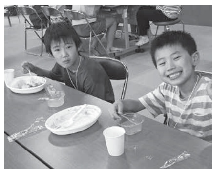
マッシュルームって美浦の特産品なんだね