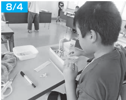
♪できるかな できるかな