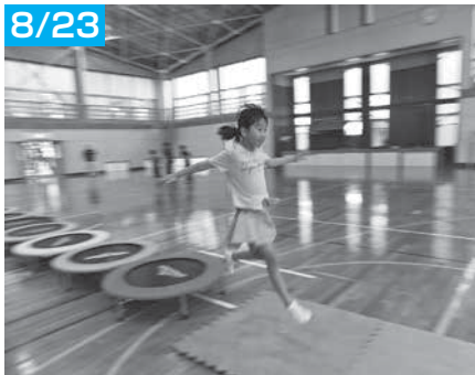
見事なトランポリン連続跳び！