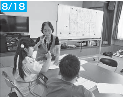
手話で自分の名前を習ったよ