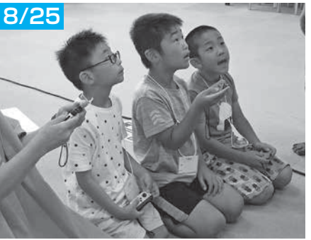
「ぷよぷよeスポーツ」で大連鎖！