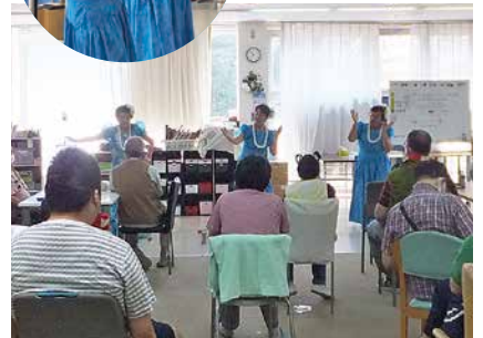
美浦フラダンス同好会の皆さんが フラダンスを披露しました