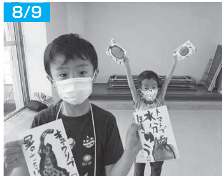
ステキな絵てがみ 誰に出そうかな？