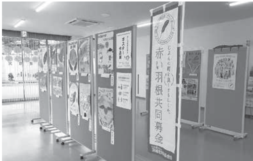
昨年度の展示の様子

日時 令和5年 10月2日(月) 12:00 ～ 10月23日(月) 18:00 場所 地域交流館みほふれ愛プラザ (美浦村宮地 1211-2) ※水曜休館