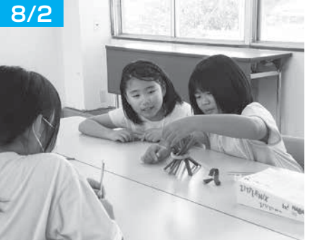
グラグラ棒、倒したら負けだよ