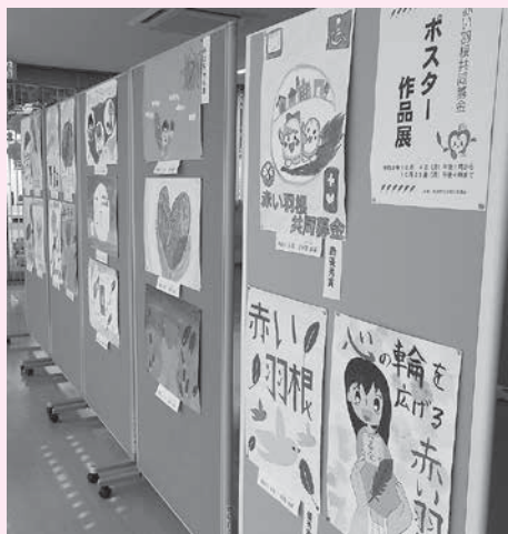
ポスター作品展の様子

「赤い羽根共同募金・ポスターコンクール」の作品展を、みほふれ愛プラザにて10月に行いました。応募していただいた43名の皆様、ご協力ありがとうございました。